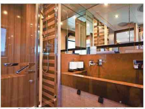
Bij elke slaapkamer hoort een privébadkamer met douche.