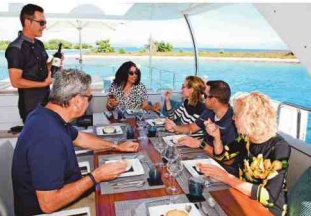
Aan boord is ook een vierpersoons crew, onder wie een chef-kok die de lunch en het diner telkens op maat maakt.

HET PRIJSCAARTJE Basisprijs: 7 miljoen euro (juli/februari 2014). Voor een Benetti-jacht van 33 meter mag je al snel uitgaan voor 15 miljoen euro. Voor een volledig uitgerust jacht van 40 m is dat 20 miljoen euro. Opties: 2 miljoen euro onder meer voor een groot op maat gemaakte kajuit (80.000 euro), een op pad technologie om welke stuurruimte met volledig ontbloot navigatiesysteem (300.000 euro), mobielkamer met verlichting rond de helix boot (80.000 euro)... Jaarlijkse kosten: 600.000 euro voor het onderhoud, de crew, verzekeringen, de ligplaats in de haven en de volledige manning. Prijt ligplaats: in de haven van Split betaal je per jaar 30.000 euro.