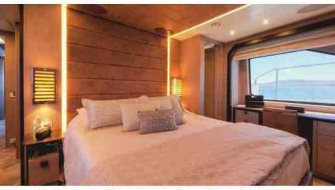
De slaapkamers zijn even luxueus als een vijfsterrenhotelzuite.

PRAKTISCH De boot: Benetti Delfino 93' Lengte: 29 meter Bouwjaar: 2014. De bouw nam twee jaar in beslag. Capaciteit: Het jacht telt vijf slaapkamers voor twee personen, is er ook een eigen badkamer met douche en toilet beschikking. Uitrusting: 16.000 liter diesel brandstof, 2.100 liter water, een ontbijtbronsalade die 250 liter/ uur/zeewater omzet in ledingewater, opvangtanks van 1.400 liter voor afvalwater, diepzeetank van 2.000 liter, een gasruimte van 4,5 m met 120 kg (70.000 euro), een luxe sportboot van 16,5 m met 2 x 260 pk TD om meeplektoeren te nemen (250.000 euro).