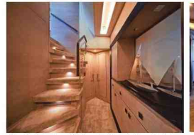
Overal is indirecte verlichting gebruikt, zoals hier onder de trap.