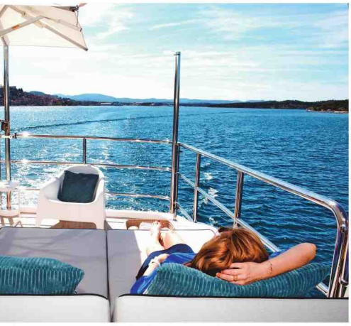
Overal op het dek zijn er zonnebedden. Hier ook relaxen geen moeite.

En zo werd Matty op zijn tiende eigenaar van een Zodiac. Acht jaar later had hij al